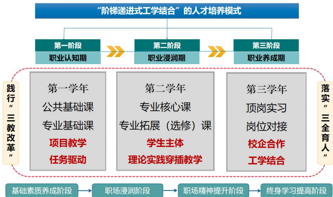
图 1 “阶梯递进式工学融合”的人才培养模式

学院深化与医院、药厂、药品经营企业的合作，定期召开专业指导委员会会议，与医院、药厂、药品经营企业等生产第一线的专家共同探讨专业建设、课程改革。收集用人单位对学生的反馈意见，通过专题研究，修订工学结合、校企合作、顶岗实习等培养人才举措。继续聘请企事业单位专家为客座教授，定期在校内开展讲座、参与理论教学与实践教学。开展订单培养，争取在三年内，与山西旺龙药业、山西云鹏制药有限公司、临汾宝珠制药有限公司、临汾市人民医院、临汾市第二人民医院等医院企业共同探讨校企合作办学模式，为医药企业进行储备人才的订单式培养，为学生设立企业助学金，并在日常管理中引入企业文化与管理理念，逐步实现学生与企业的深度融合，真正实现毕业生就业选择与企业人才录用的无缝对接。