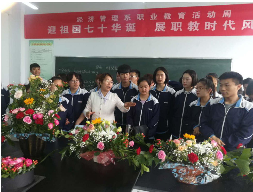
教师点评插花作品