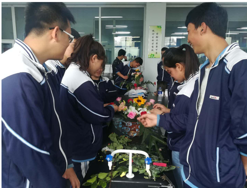
教师指导学生艺术插花