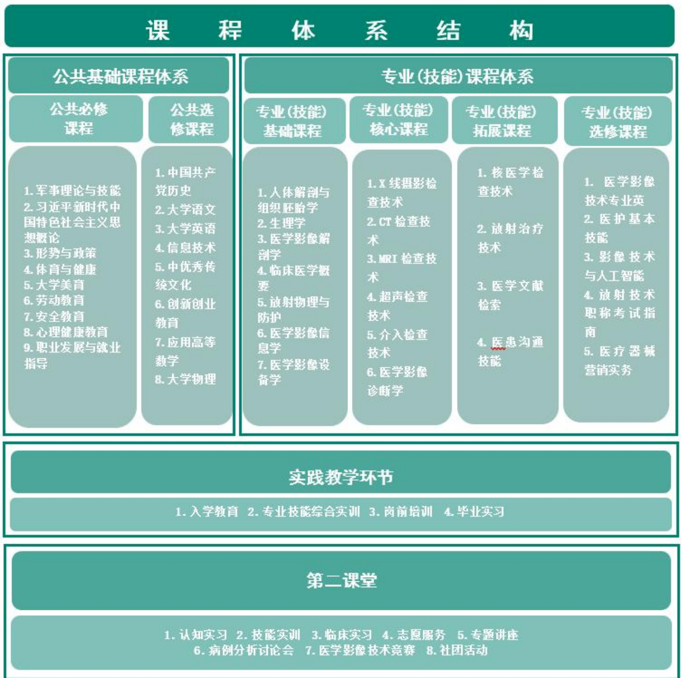
图 1 医学影像技术专业课程体系结构图