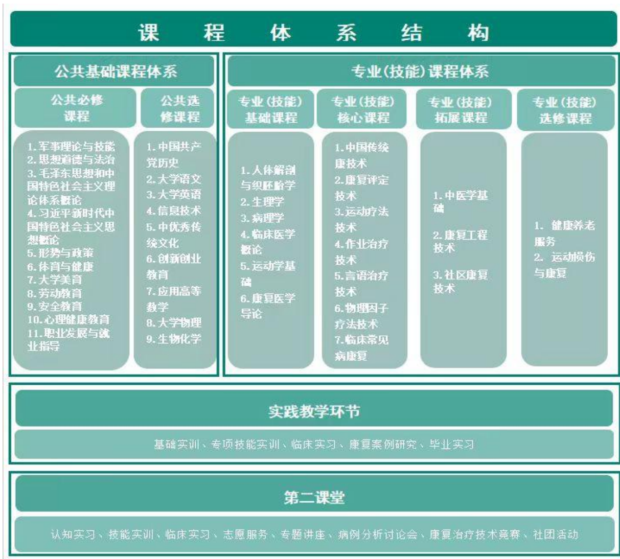
图 1 康复治疗技术专业课程体系结构图