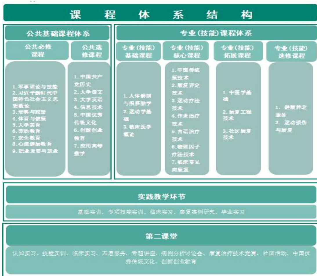
图 1 康复治疗技术专业课程体系结构图