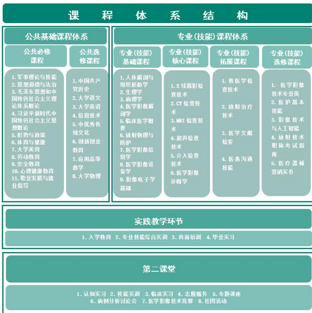
图 1 医学影像技术专业课程体系结构图