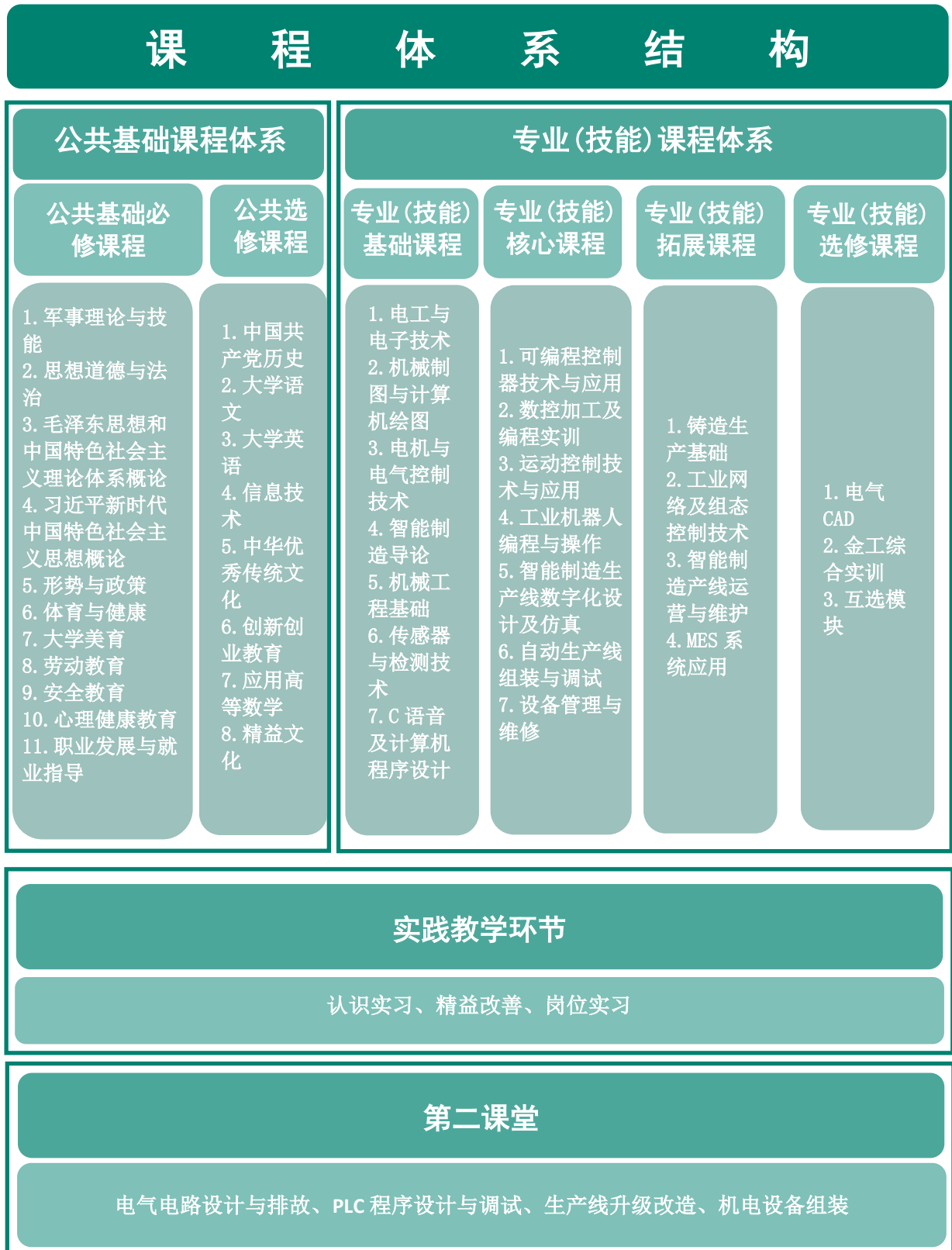
图 1 机电一体化技术专业课程体系结构图