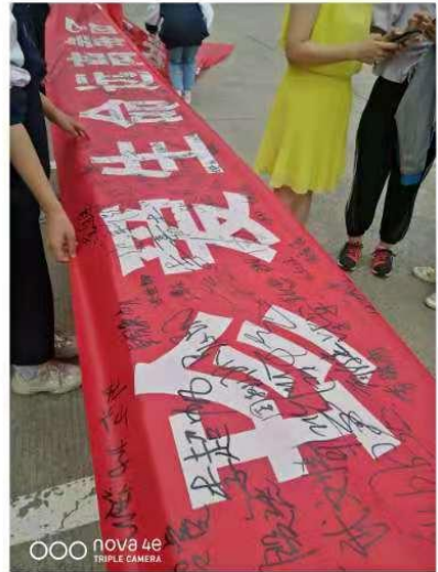
活动现场中，老师们的身影。