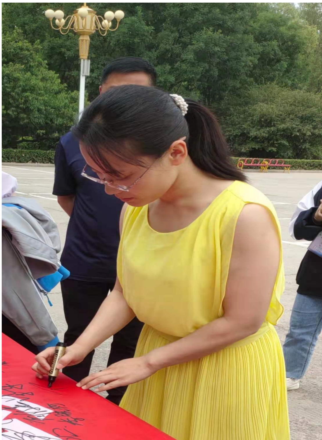
活动中，学生志愿者相互讨论，畅谈感想——珍爱生命远离毒品。